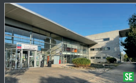
Service Communication UIMM Loire / décembre 2023 - Document non contractuel - © adobeStock